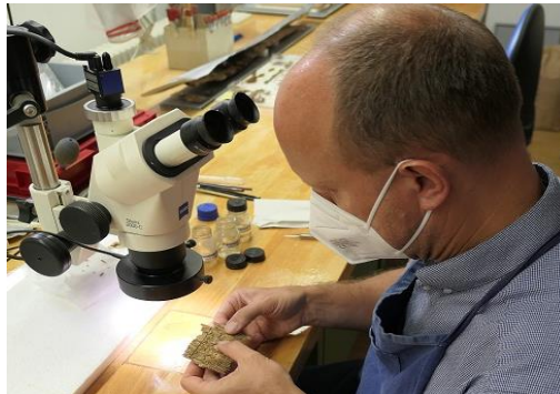
Funde Deiningen, Kamm in der Restaurierung (Grab aus 6. Jahrhundert).