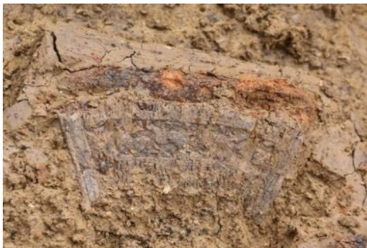
Funde Deiningen, Kamm bei der Ausgrabung (Grab aus 6. Jahrhundert).