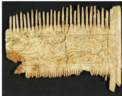
Funde Deiningen, Rückseite des restaurierten Kamms (Grab aus 6. Jahrhundert).