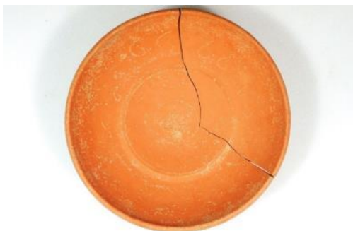
Funde Deiningen, Schale (Grab aus 6. Jahrhundert).