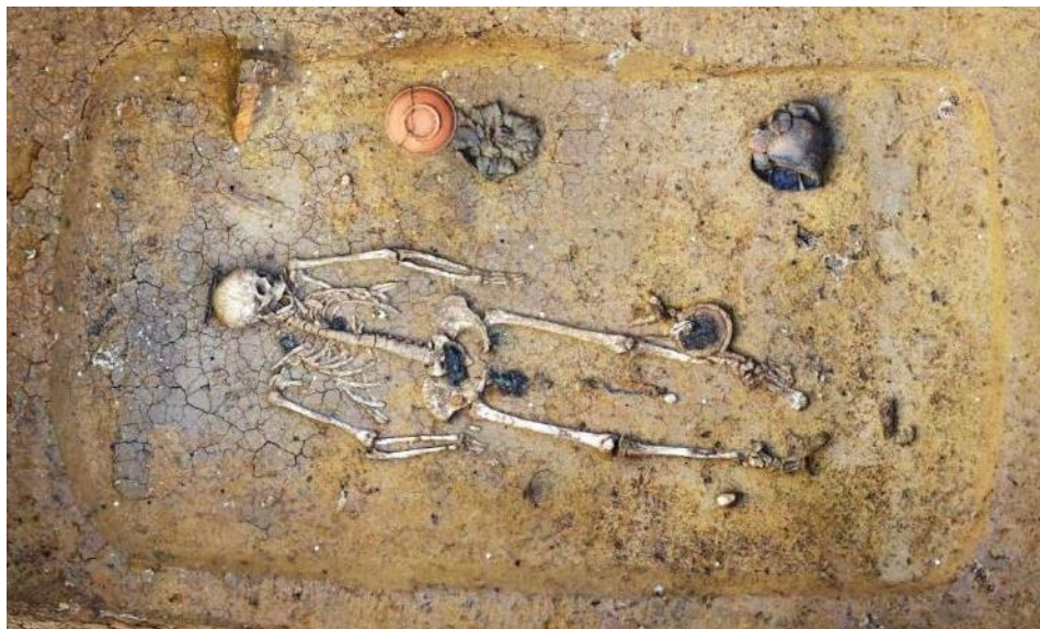
Funde Deiningen, Frauengrab aus dem 6. Jahrhundert mit Schale.