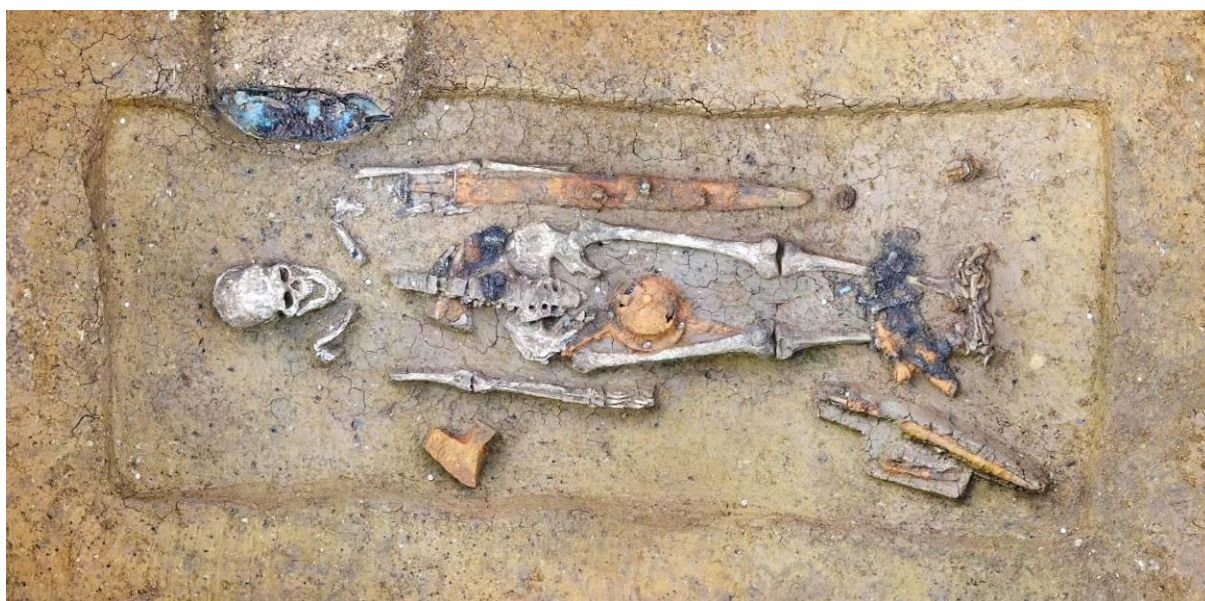
Funde Deiningen, Männergrab aus dem 6. Jahrhundert mit Kamm.