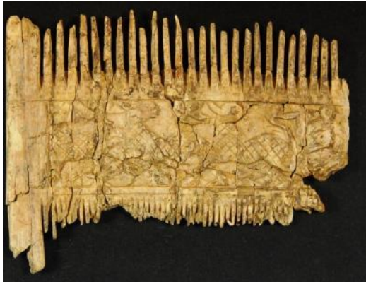
Funde Deiningen, Vorderseite des restaurierten Kamms (Grab aus 6. Jahrhundert).

Zur aktuellen redaktionellen Berichterstattung stellen wir Ihnen gerne Bildmaterial zum Download unter www.blfd.bayern.de/blfd/presse zur Verfügung. Bei einer anderweitigen Nutzung bitten wir Sie, selbständig die Fragen des Urheber- und Nutzungsrechts zu klären.