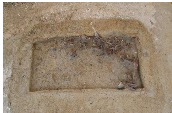
Skelett des kopflosen Pferdes, Vöhringen