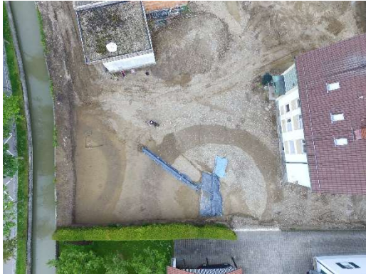
Luftbild der Ausgrabung in Vöhringen

Zur aktuellen redaktionellen Berichterstattung stellen wir Ihnen gerne Bildmaterial zum Download unter www.blfd.bayern.de/blfd/presse zur Verfügung. Bei einer anderweitigen Nutzung bitten wir Sie, selbständig die Fragen des Urheber- und Nutzungsrechts zu klären.