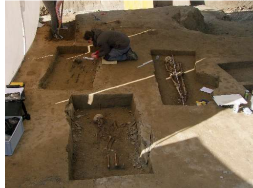
Ausgrabung in Vöhringen mit drei freigelegten Bestattungen