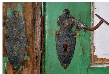
Schlüsselschilder und Türdrücker