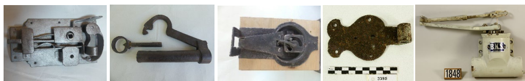
Türschloß; Vorhängeschloß; Truhenschloß (Abb.: Dr. Welker); Schippenband und Schließer (Abb. BLfD)