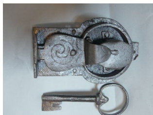
Truheenschloß mit Schlüssel (Abb.: Dr. Welker)