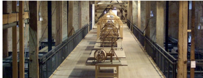
Dachwerk-Modelle im Bauarchiv Thierhaupten.