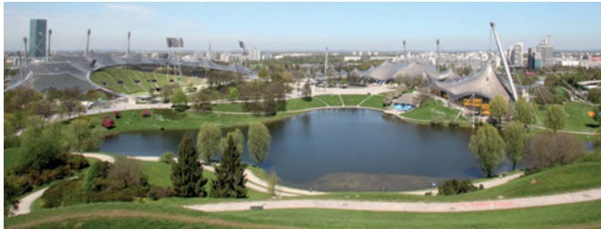
Olympiapark München.