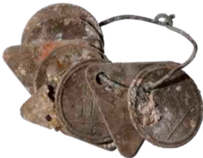
Markenbündel, geborgen 2016 bei Ausgrabungen in der Gießereihalle.

Wir verfassen Artikel zum Thema 80 Jahre Kriegsende in Ingolstadt . Anmeldung über die VHS Ingolstadt Anmeldeschluss: 22. April 2025 Max. 10 Teilnehmer