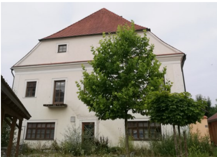
Imposanter Bau mit Halbwalmdach