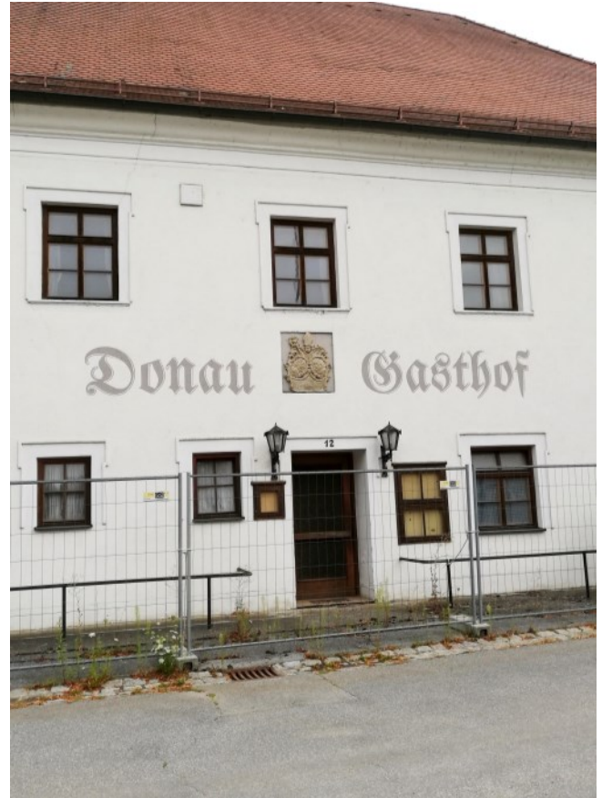
Willkommen im Donau Gasthof!