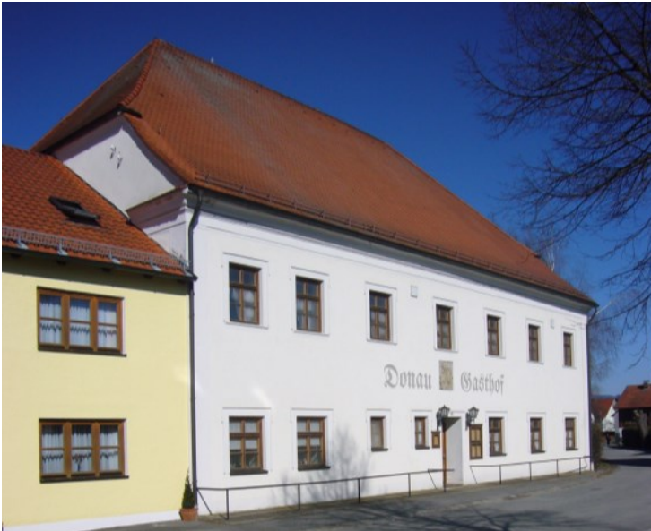
Der Donau Gasthof Dreher in Niederalteich