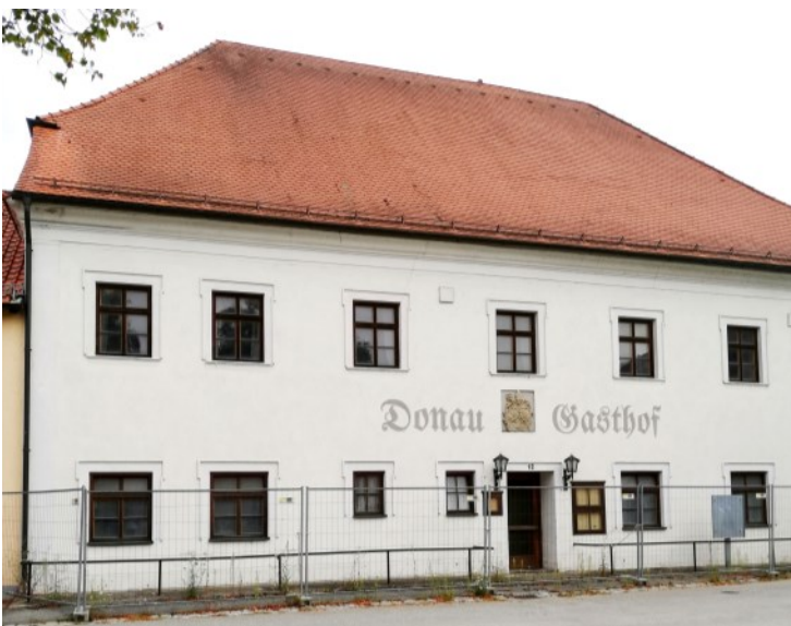
Barocker Gasthof von 1703