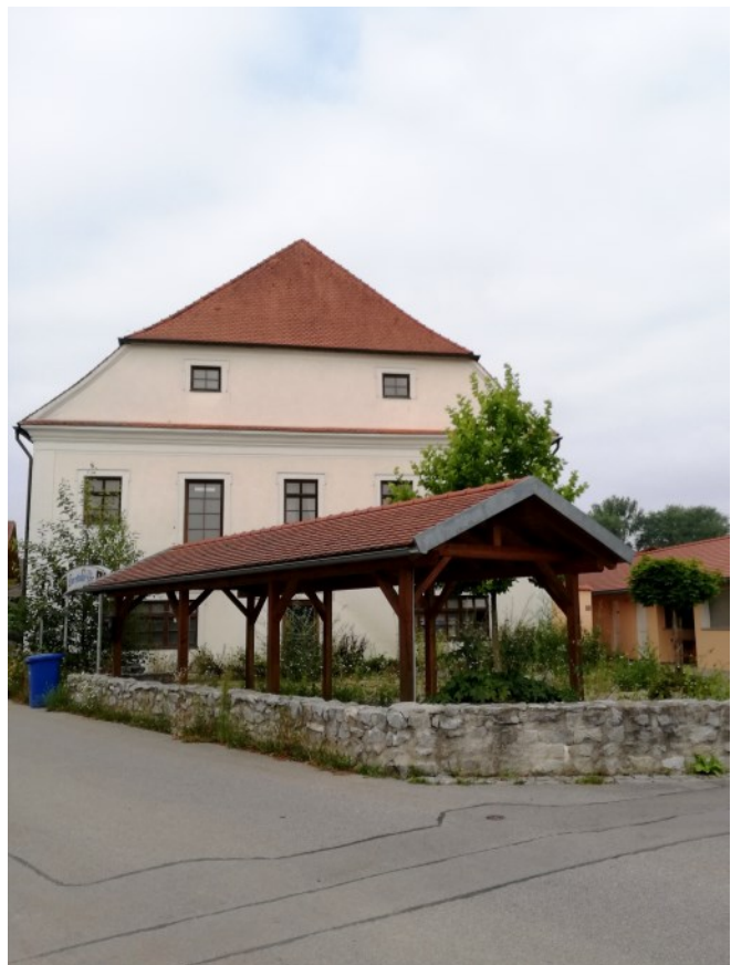
Attraktives Gasthaus mit Biergarten