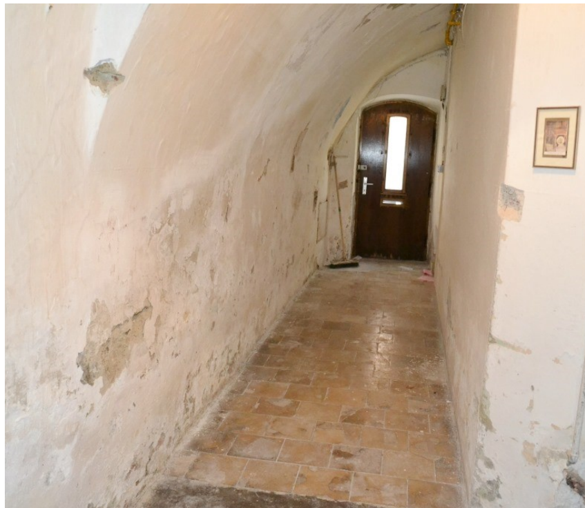
Eingangsbereich mit Gewölbedecke