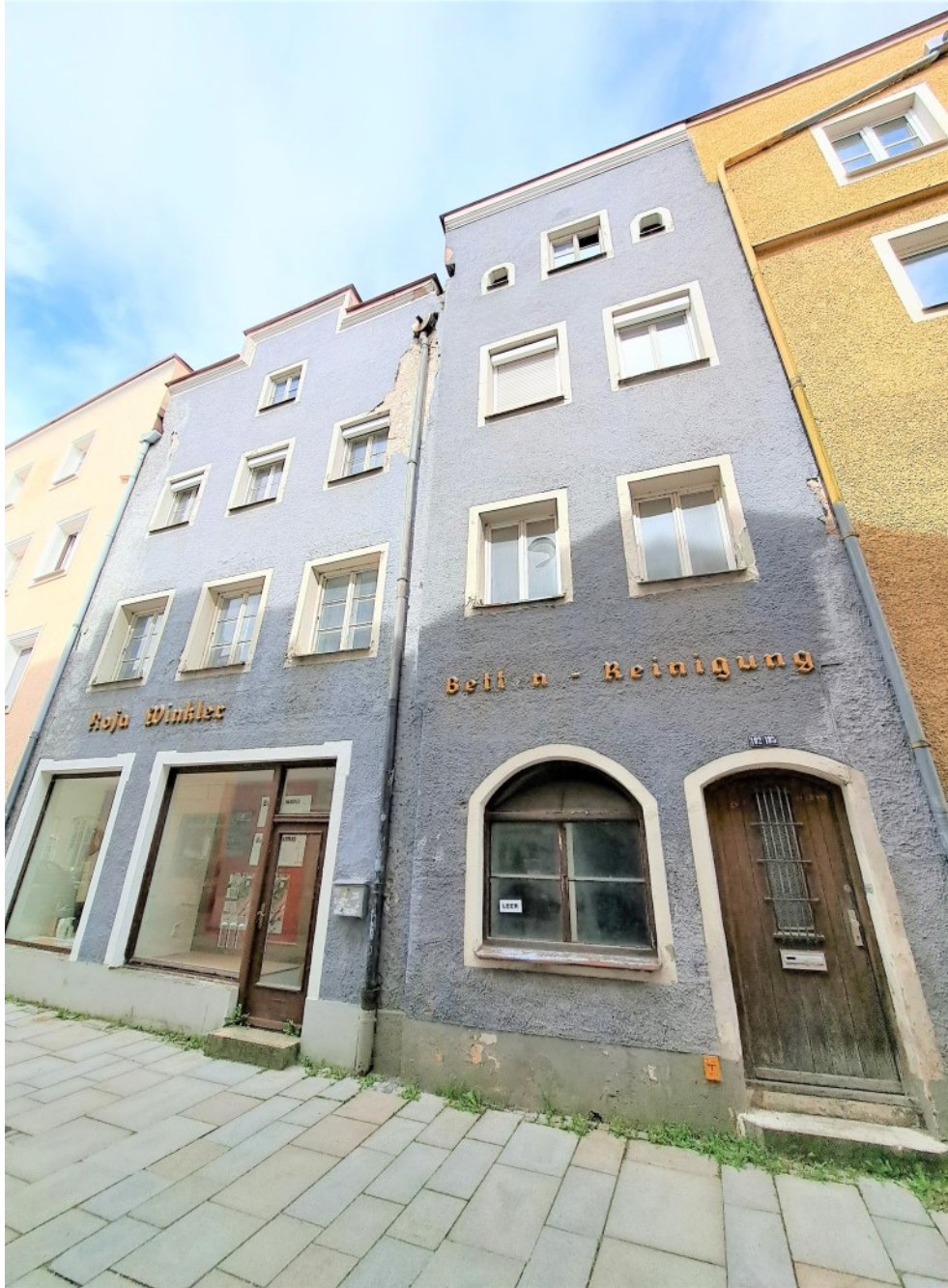
Historischer Altstadtbau am Fuße der Burg