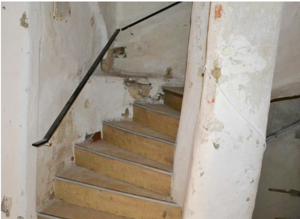
Historische Treppe in die oberen Etagen