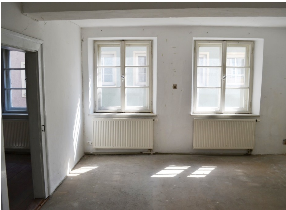
© (W. Ritter) Wohnraum mit Zentralheizung