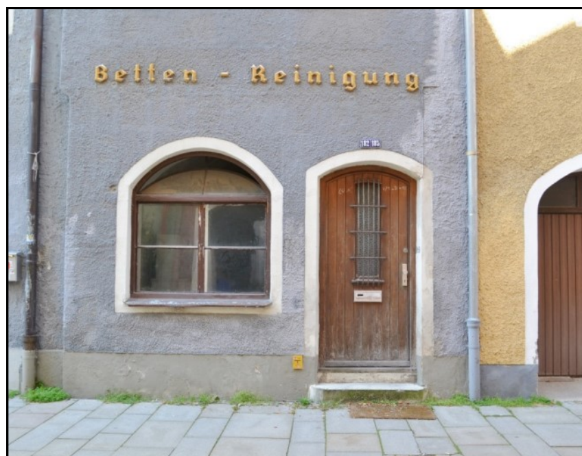
© (W. Ritter) Historisches Wohn- und Geschäftshaus des 15. Jh.

Der erfolgreiche Verkauf des Anwesens sowie anderweitige Sachverhaltsänderungen sind dem BLfD unverzüglich mitzuteilen. Die Beschreibung des Denkmals (Objektexposé) wird dann auf entsprechenden Hinweis des Verkäufers entfernt werden. Schäden, die durch unterlassene oder fehlerhafte Informationen des Verkäufers entstehen, sind von diesem zu tragen.