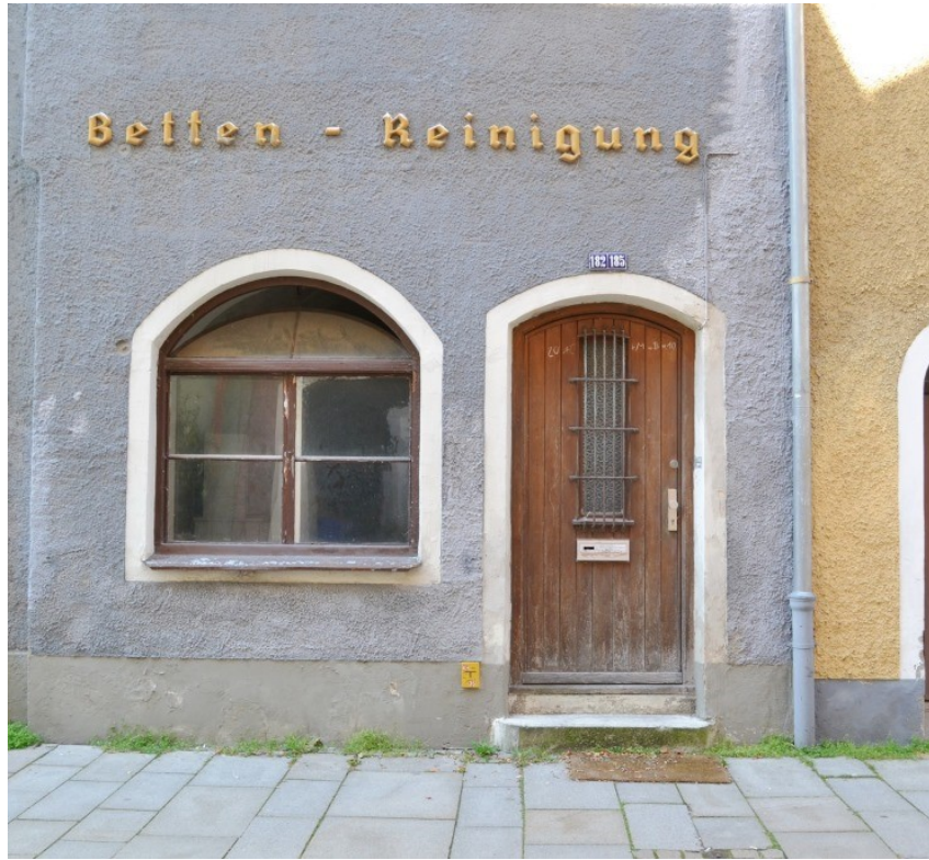
Statthaus in reizvoller Altstadtlage