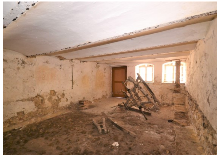
Ehemaliger Roßstall des Anwesens