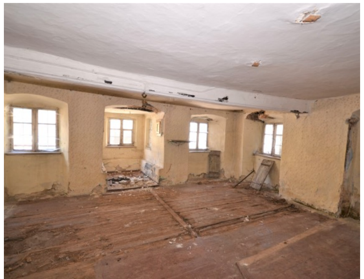
Frühere Gaststube mit Steherker