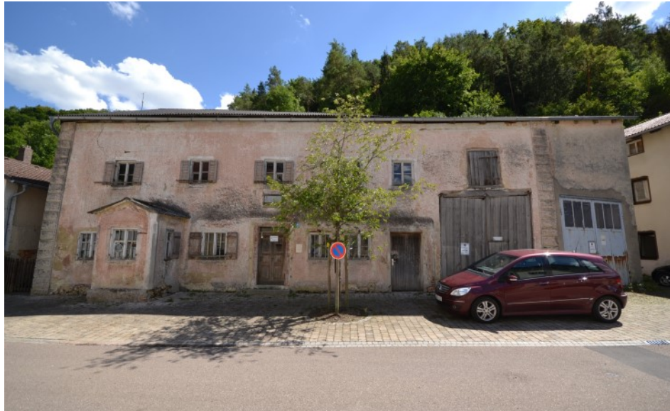
Historisches Jura-Gasthaus „Johann Stett“