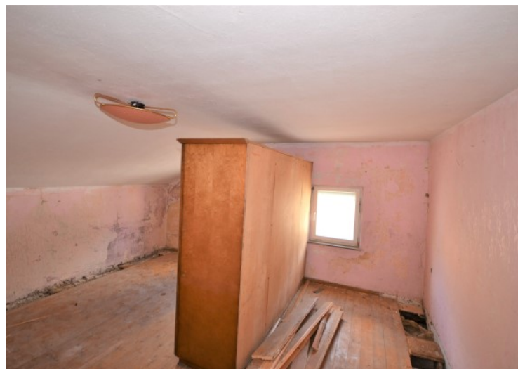
Historischer Wohnraum im DG