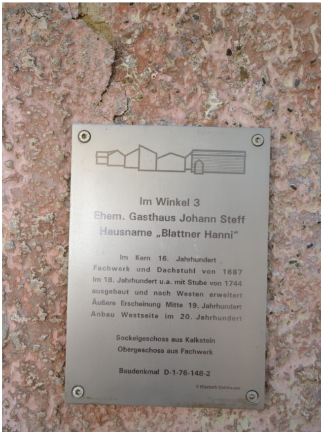
Informationstafel zum Gasthaus