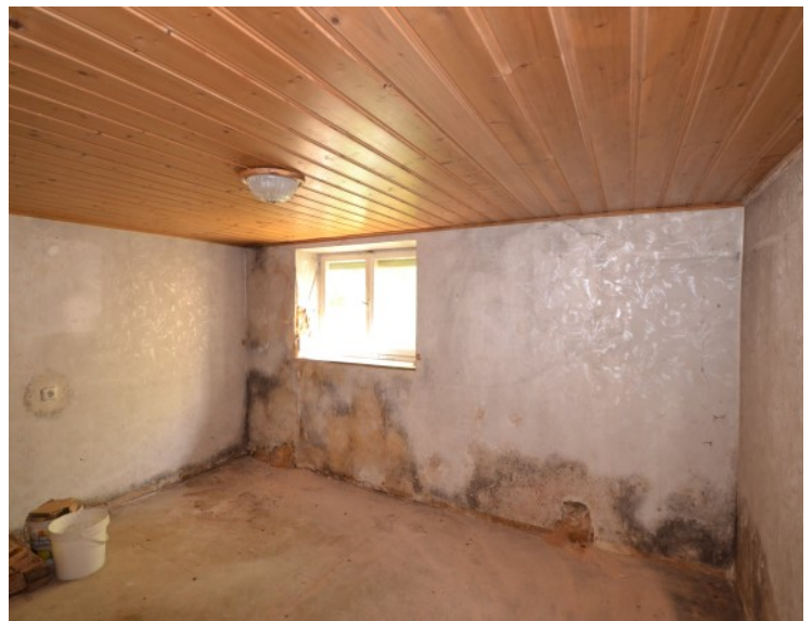
Neu gestaltbares Zimmer