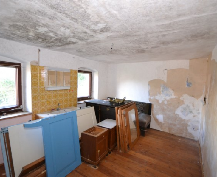
Ehemalige Küche des Hauses