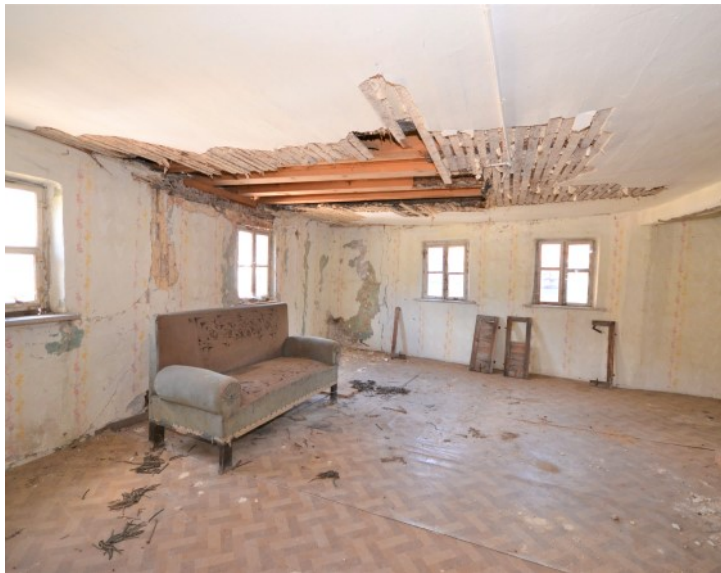
Wohnraum mit historischen Fenstern