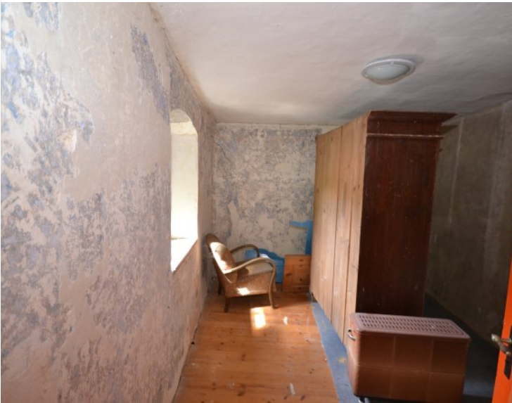
Historisches Zimmer im OG