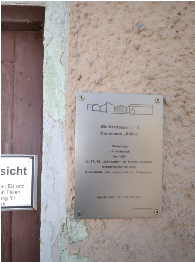
Informationstafel zum Jurahaus