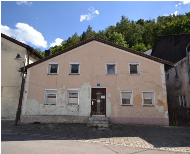
© (G. Gronauer) Das Jurahaus Marktstraße 1, 2