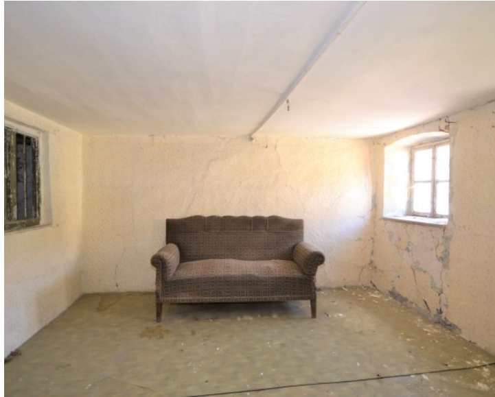
Wohnraum von „anno dazumal“