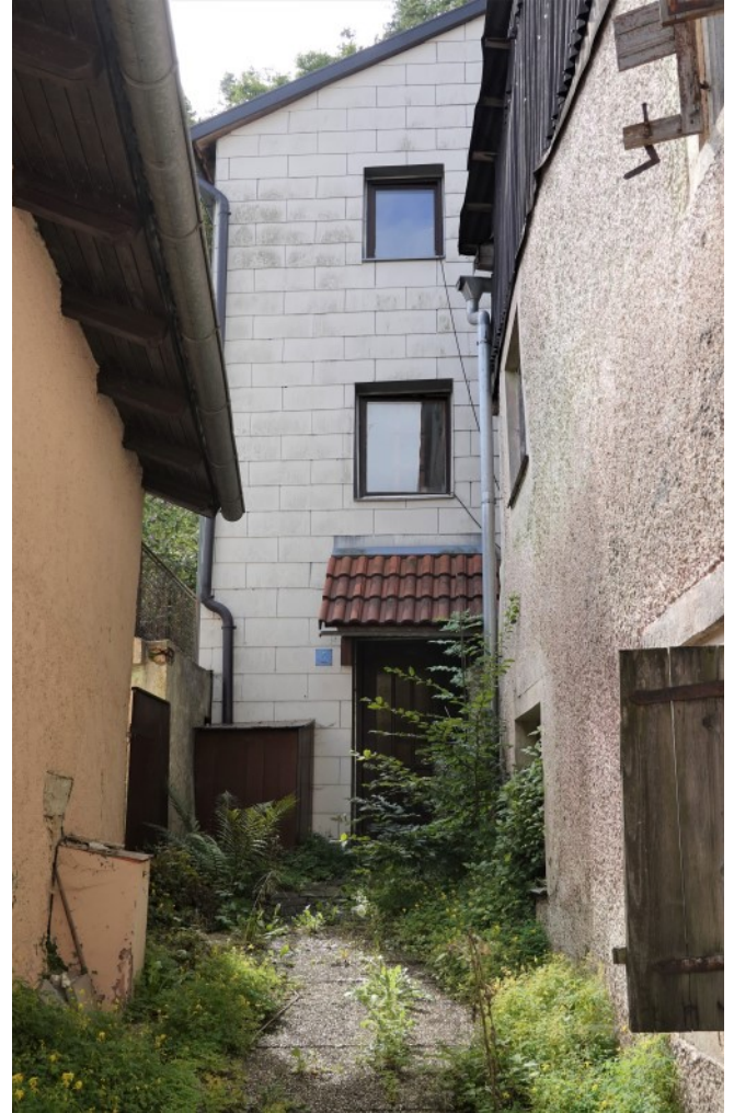
Das Wohnhaus Im Winkel 2