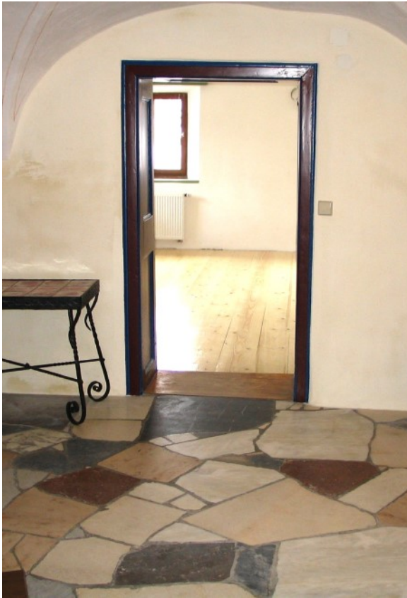
Reizvoller Wohnbereich mit historischem Flair