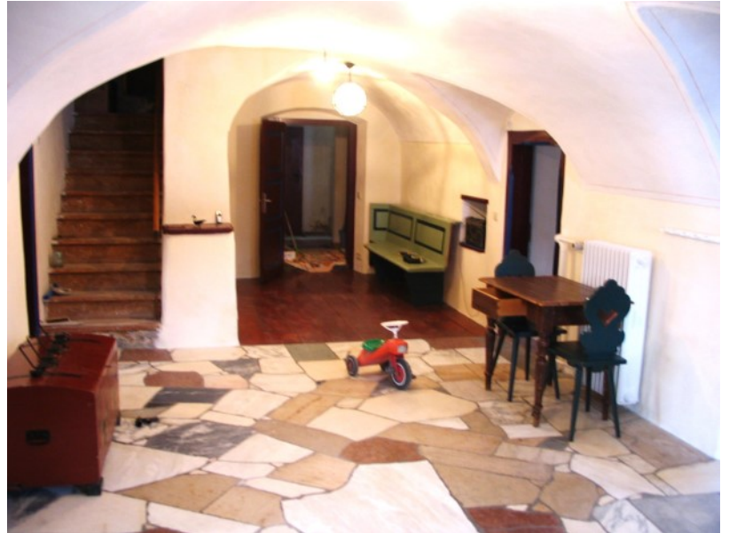
Ursprünglicher Flur mit Tonnengewölbe