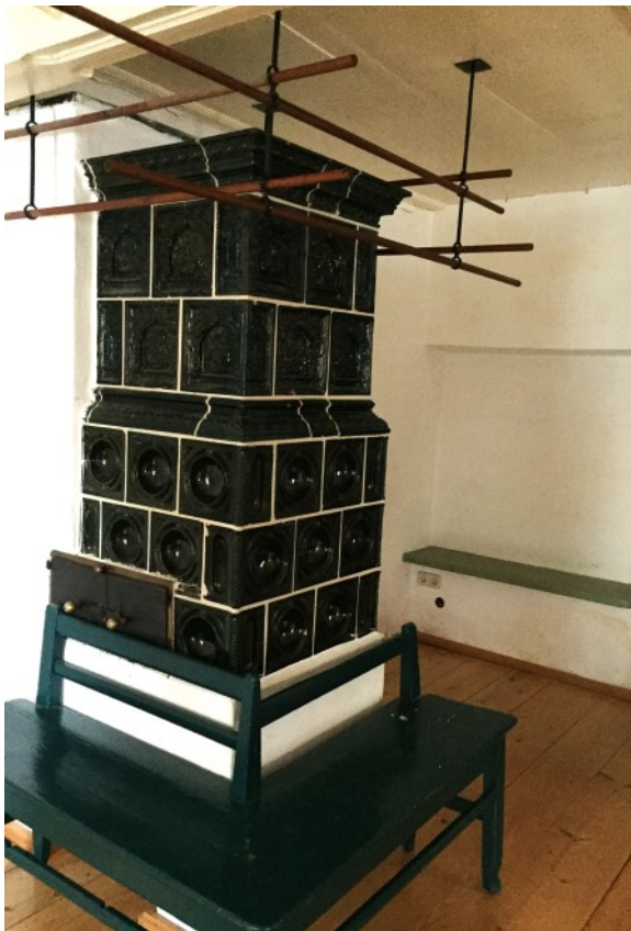
Uriger Kachelofen mit Sitzbank