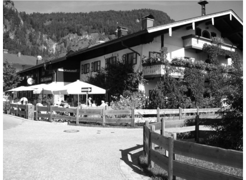
Das frühere Gasthaus „Zum Kuhstall“