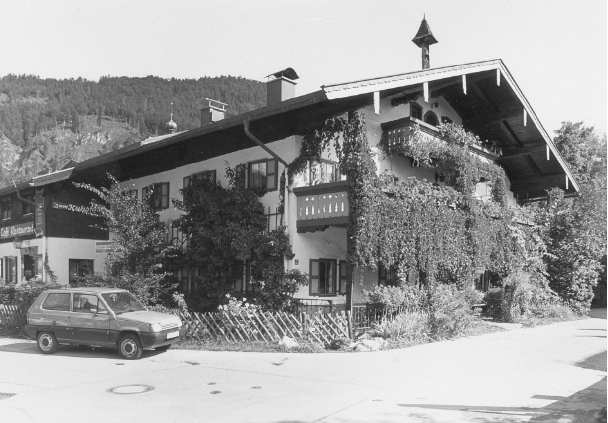
Historische Aufnahme des alpenländischen Anwesens