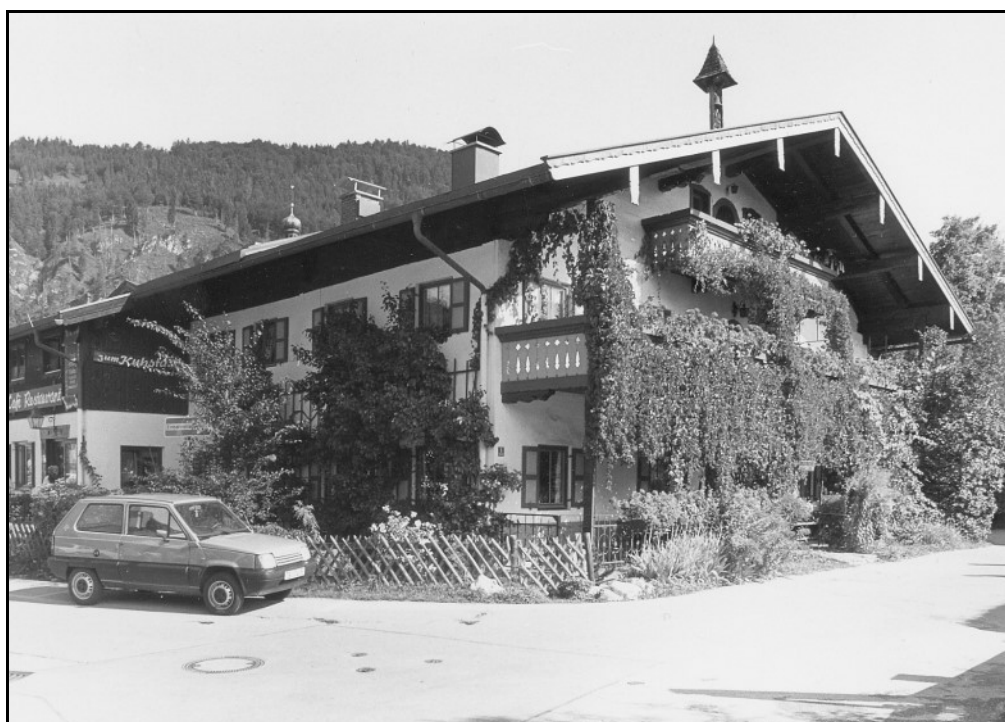
Historische Aufnahme des Gasthauses „Zum Kuhstall“

Der erfolgreiche Verkauf des Anwesens sowie anderweitige Sachverhaltsänderungen sind dem BLfD unverzüglich mitzuteilen. Die Beschreibung des Denkmals (Objektexposé) wird dann auf entsprechenden Hinweis des Verkäufers entfernt werden. Schäden, die durch unterlassene oder fehlerhafte Informationen des Verkäufers entstehen, sind von diesem zu tragen.