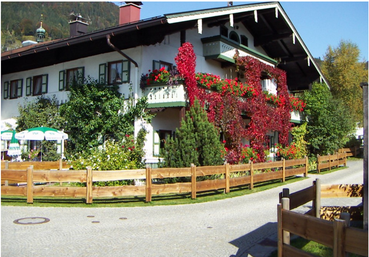
Traditionelles Traunsteiner Gebirgshaus des 18. Jahrhunderts