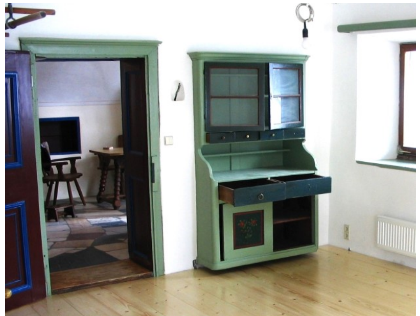
Traditionelle Zimmer mit regionaltypischem Mobiliar