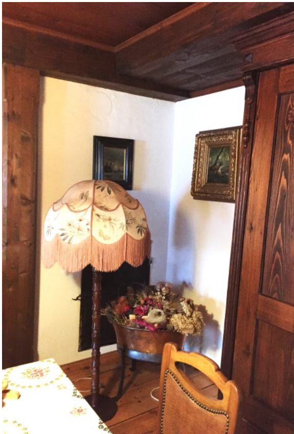
Stilvoll gestalteter Wohnbereich