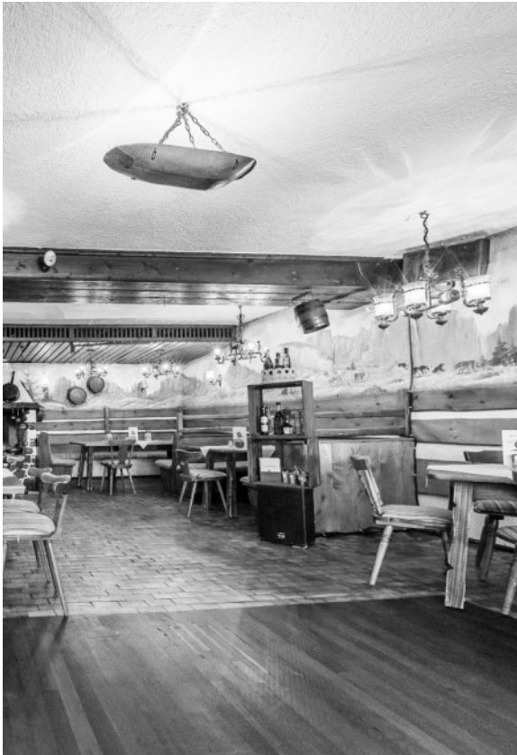
Ehemalige Gaststube im früheren Wirtschaftsteil