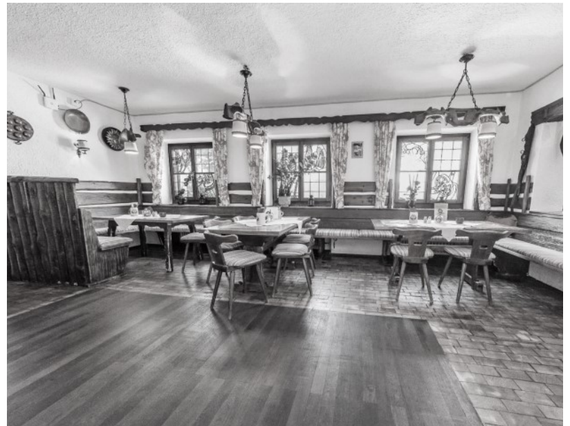
Ehemals gemütliches Restaurant mit typisch bayrischem Charme