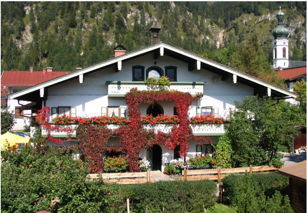
Malerischer Frontgiebel mit Giebel- und Hochlaube