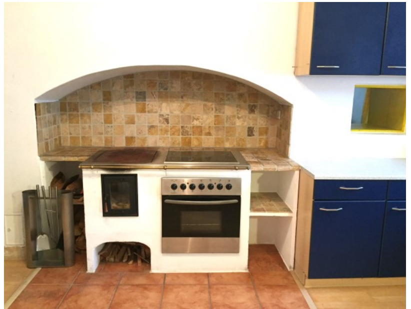
Stilvoll angepasste Küche