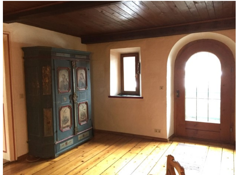
Wohnraum mit historischem Ambiente