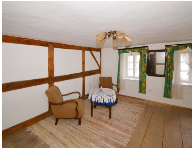
Zimmer mit Innenfachwerk im DG