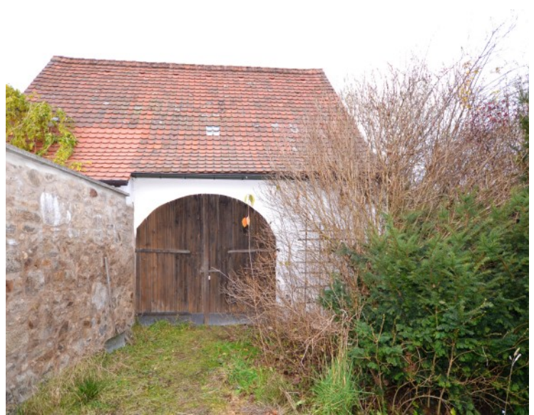
Scheune im rückwärtigen Bereich