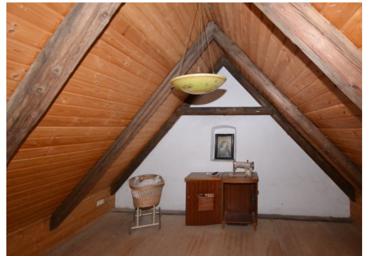
Zimmer im Spitzboden