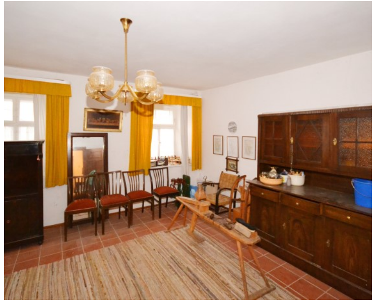
Stilvoll gestalteter Wohnraum im EG