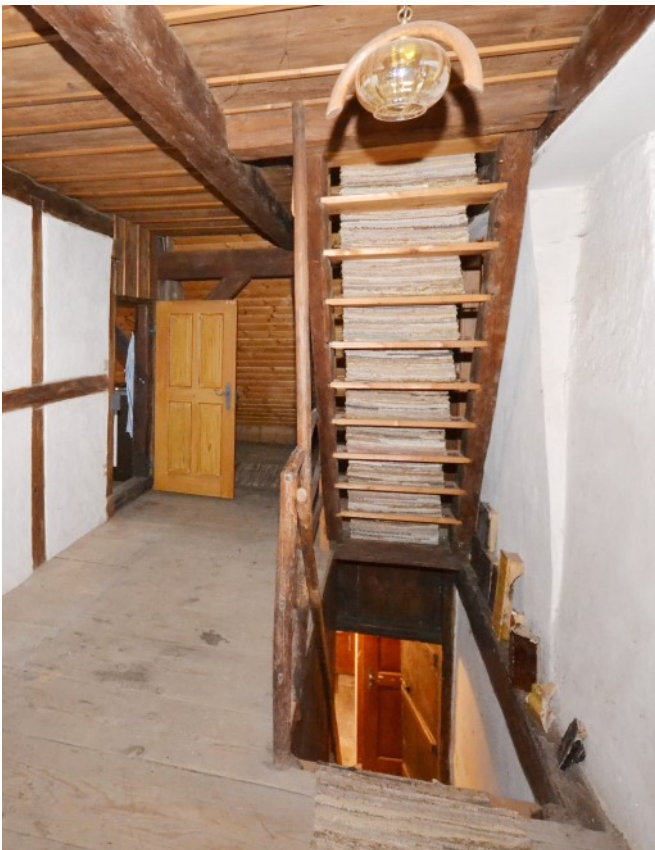
Treppenaufgang ins DG