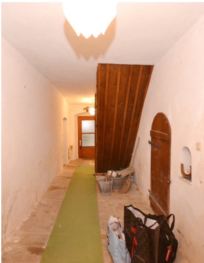
© (G. Gronauer) Flurbereich im Erdgeschoss