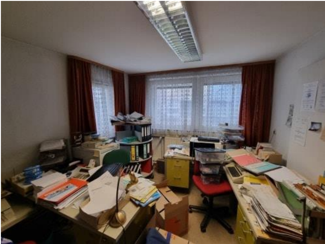
Zimmer 2 EG