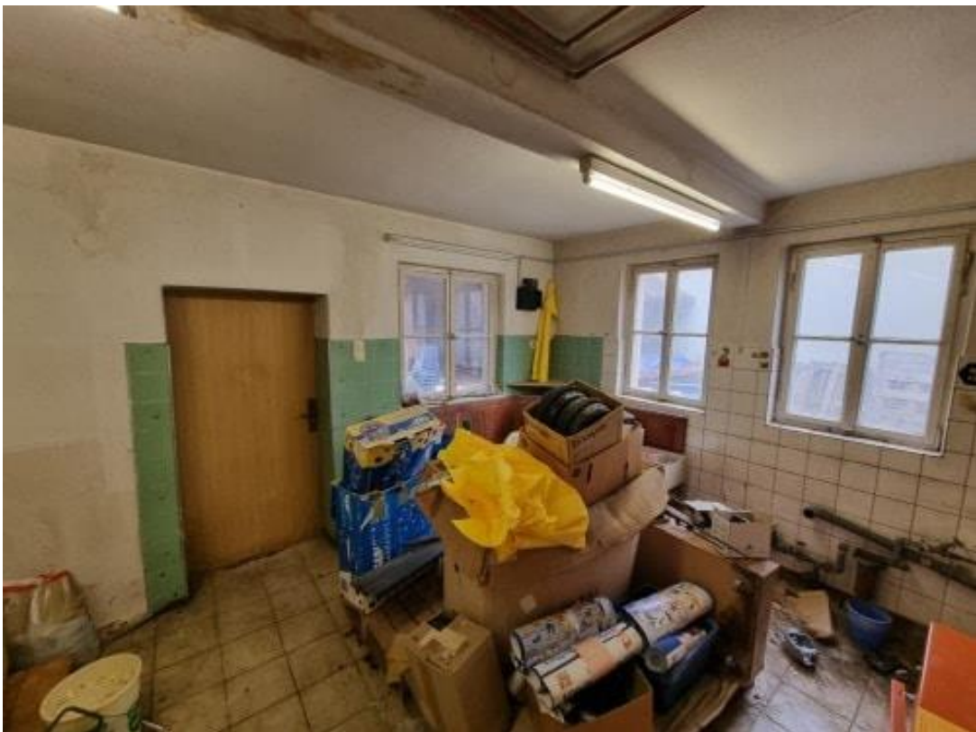
Heiz- u. Technikraum