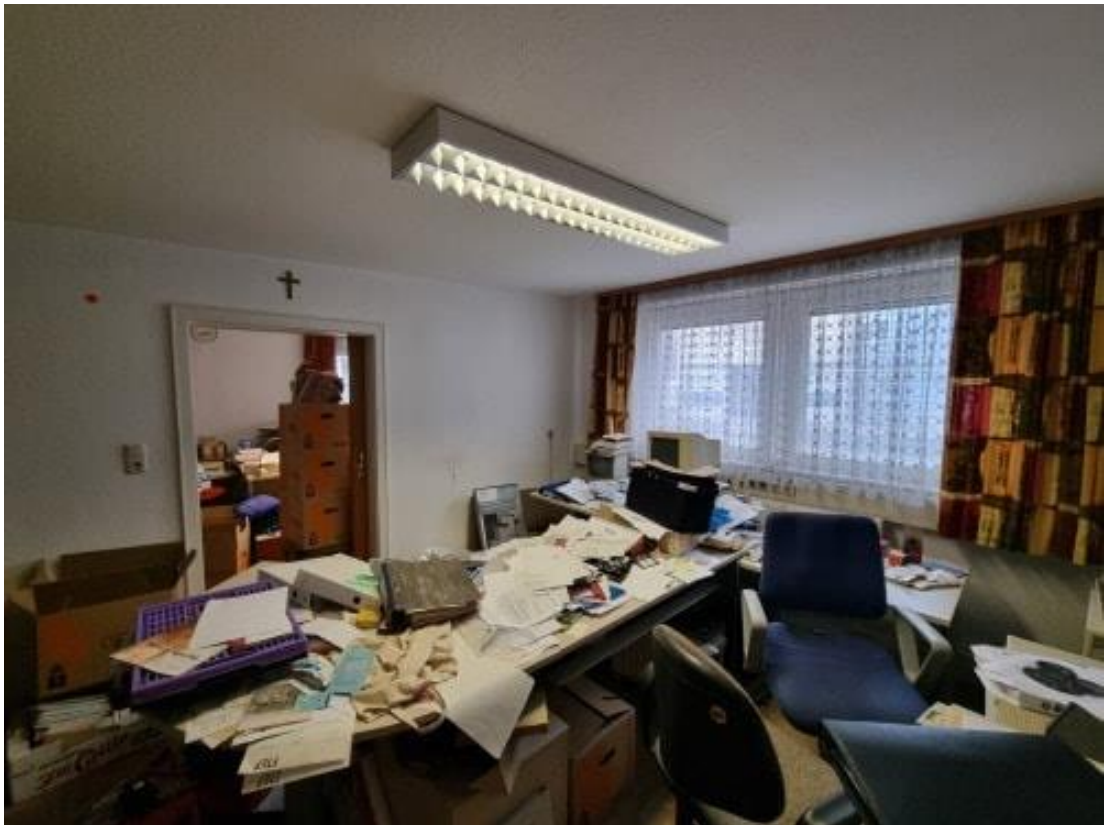
Zimmer 1 EG