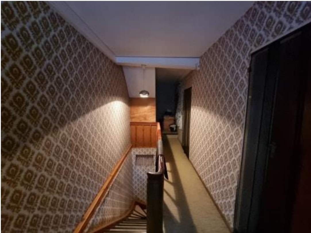
Treppe + Flur OG