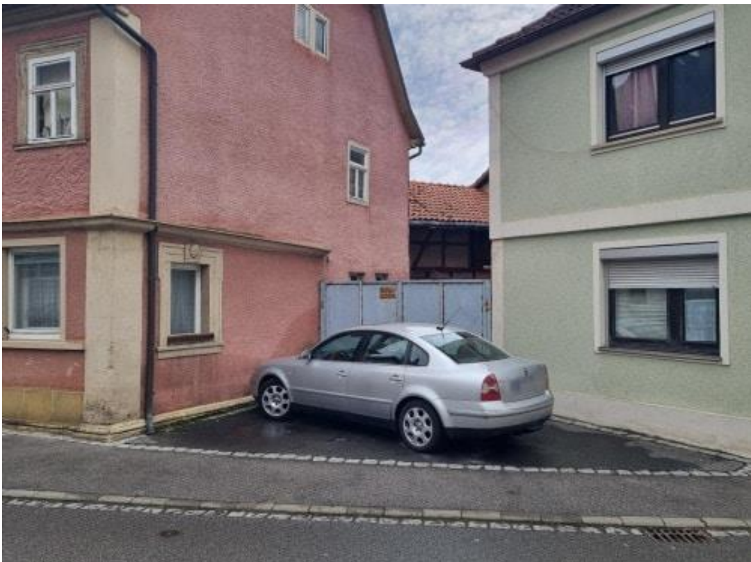
Toranlage mit Zufahrt Innenhof