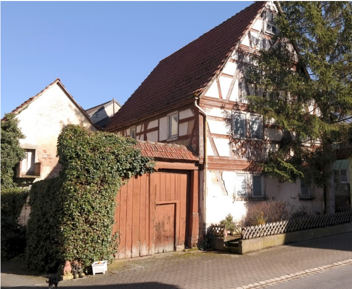
Reizender Bauernhof in Ortskernlage