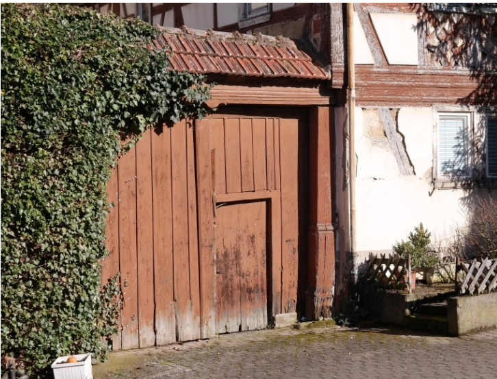
Malerischer Zugang zu Ihrem Zuhause