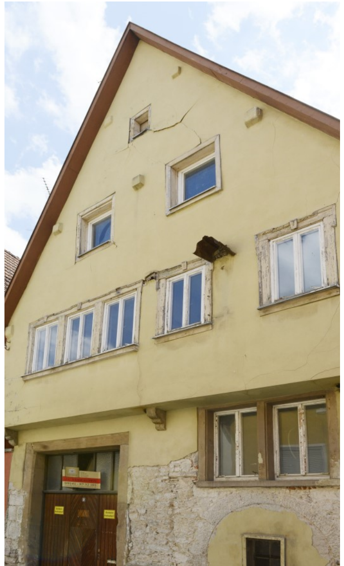
Historischer Altstadtbau des 15. Jahrhunderts