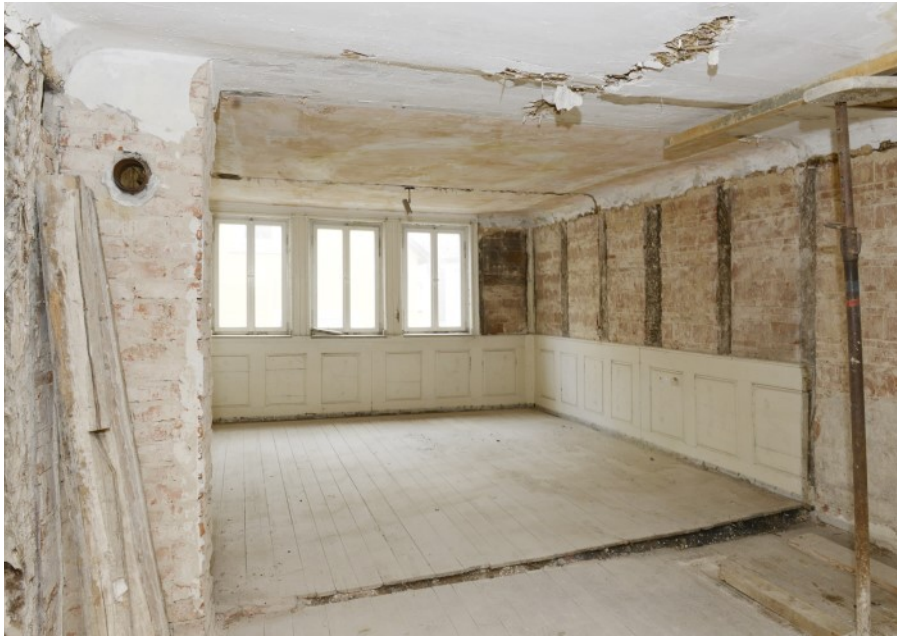
Neugestaltbarer Wohnraum im OG