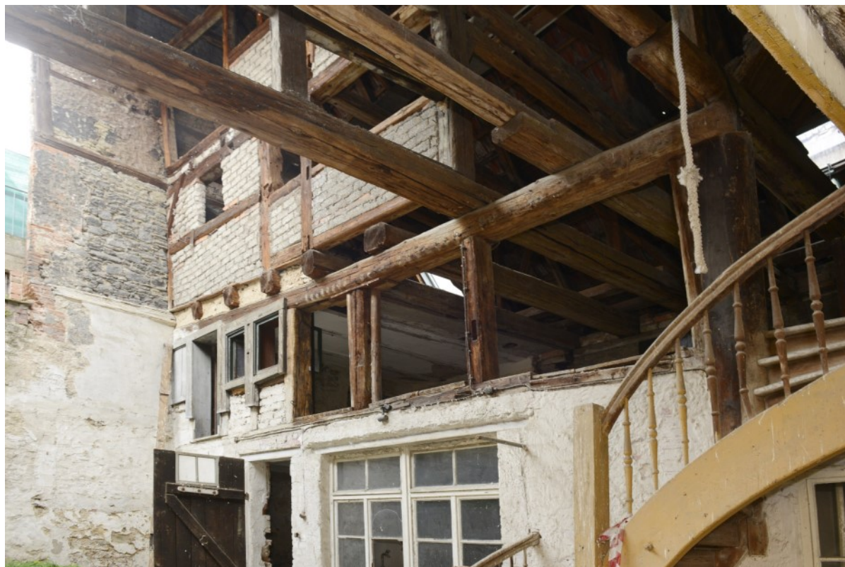
Vielseitig gestaltbare Trockenlaube

Der erfolgreiche Verkauf des Anwesens sowie anderweitige Sachverhaltsänderungen sind dem BLfD unverzüglich mitzuteilen. Die Beschreibung des Denkmals (Objektexposé) wird dann auf entsprechenden Hinweis des Verkäufers entfernt werden. Schäden, die durch unterlassene oder fehlerhafte Informationen des Verkäufers entstehen, sind von diesem zu tragen.