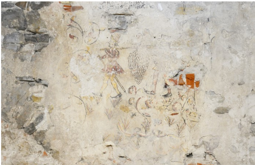
© (G. Gronauer) Gemalte Szene aus dem Alten Testament