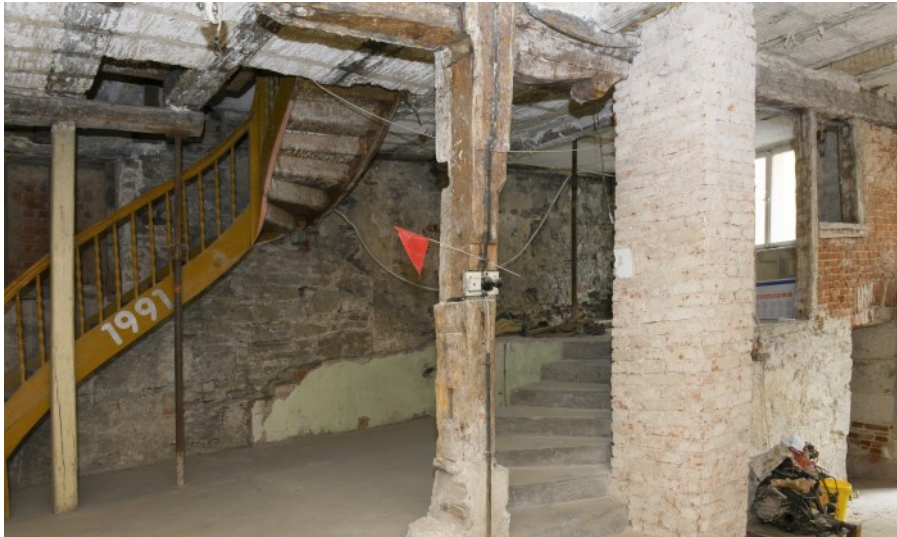
Treppenaufgang ins OG