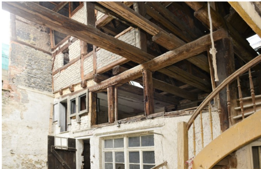
Ehemalige Trockenlaube des 16. Jhd.