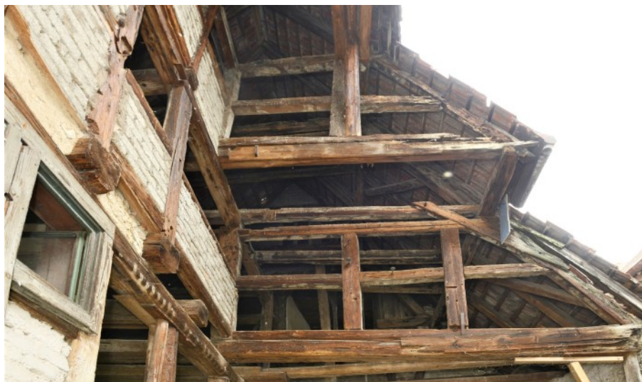
Dreigeschossige Trockenlaube im rückwärtigen Bereich