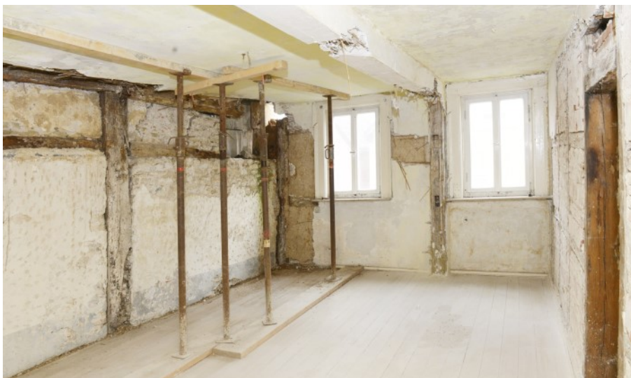
Ehemaliger Wohnraum mit Dielenboden